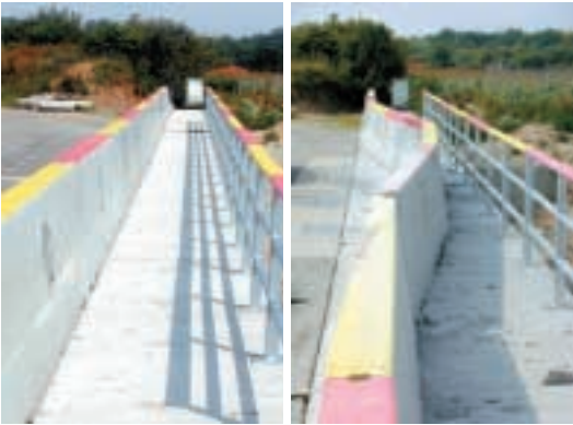
Schutzwand vor und nach dem Anprallversuch